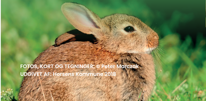
FOTOS, KORT OG TEGNINGER: © Peter Marozak UDGIVET AF: Horsens Kommune 2018

Den europæiske vildkanin er stamfader til tamkaninen, og selv efter mange hundrede års fangenskab, adskiller vildkanin og tamkanin sig ikke væsentligt fra hinanden. Den europæiske vildkanin kommer sandsynligvis oprindeligt fra den liberiske Halvø, hvorfra den har bredt sig til Vest- og Centraleuropa. Danmark og Sydsvrige er nordgrænsen for kaninernes naturlige udbredelse.