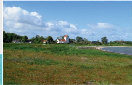
Udsigt til badestrand og kirke.

I byen findes stadig en række butikker og servicefunktioner, der dækker boernes daglige fornødenheder - købmand, posthus, bibliotek og gæstgiveri.