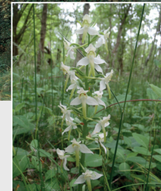
Skov-gegellie er knyttet til løvskove og krat