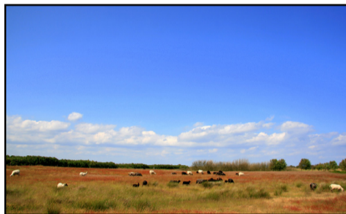
Naturpleje på Øvre

Den første infotavle er placeret på Havnen, og er en introduktion til ruten. På infotavlerne er der en QR kode, som fører dig ind på Endelave Lægeurtehaves hjemmeside, hvor du kan læse mere om nogle af de emner, der beskrives på tavlerne. NaTour de Endelave er selvfølgelig ikke forbeholdt cyklister, men kan også vandre.