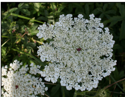
Vild Gulerod ved Sønderhavet. Den røde blomst midt i skærmen har til formål at tiltrække insekter til bestøvning.

Ellers fortsætter ruten til venstre ad Lynger, og på Gøgeurtvej møder du infotavle nr. 7. Så går turen gennem sommerhusområdet og ude ved vandet er endnu en tavle placeret. Her skal du nu til højre ad græsstien, som på det første stykke er god at cykle på. Inden møllerne kommer en strækning, hvor stien ikke er god at cykle på, og her må trækkes.