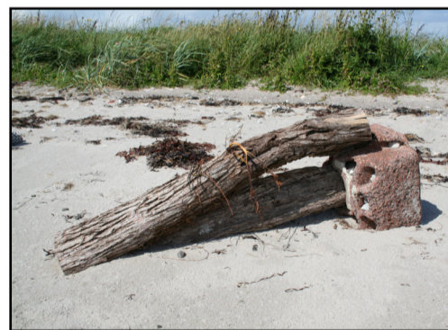
Strandkunst ved klinten

Ruten fortsætter mod Klinten, og nogle steder er stien god nok til at cykle på, andre steder må cyklen trækkes. Ved Klinten er infotavle nr. 10 placeret, og her drejer du til højre op ad græsstien. Ruten går tværs over Naturlejrpladsen og P-pladsen og kommer ud til Vesterby, som er en asfalteret vej, og her findes endnu en infotavle.