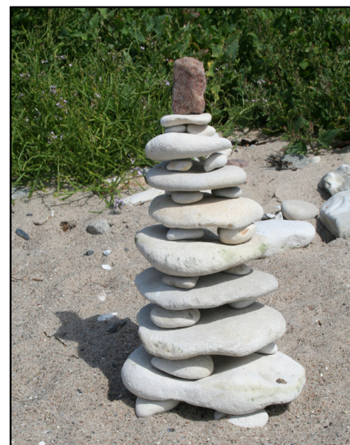
Der er inspiration til at lege med sten via QR koderne på infotavlerne.

Efter turen kan du også finde opgaverne derhjemme på websiden www.endelave-laegeurtehave.dk