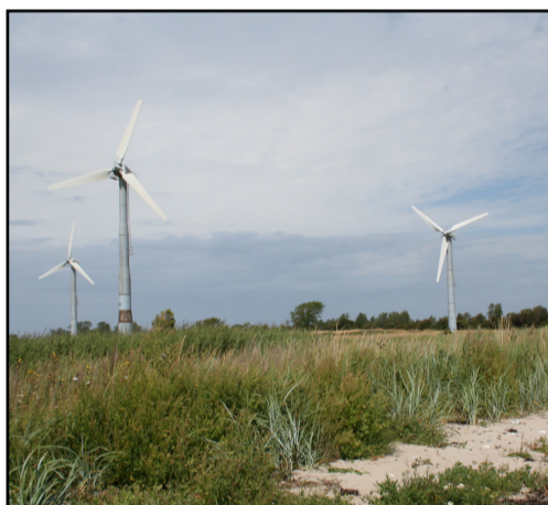
Møllerne ved Søndermølle

Hvis man vil undgå strækninger, hvor der skal trækkes på stranden, kan man afslutte turen her og cykle tilbage til byen ad Kongevejen.